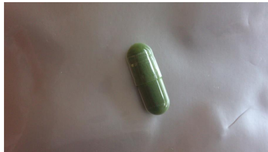
McBピュアハードカプセル(商品番号:H1・H2・H3)