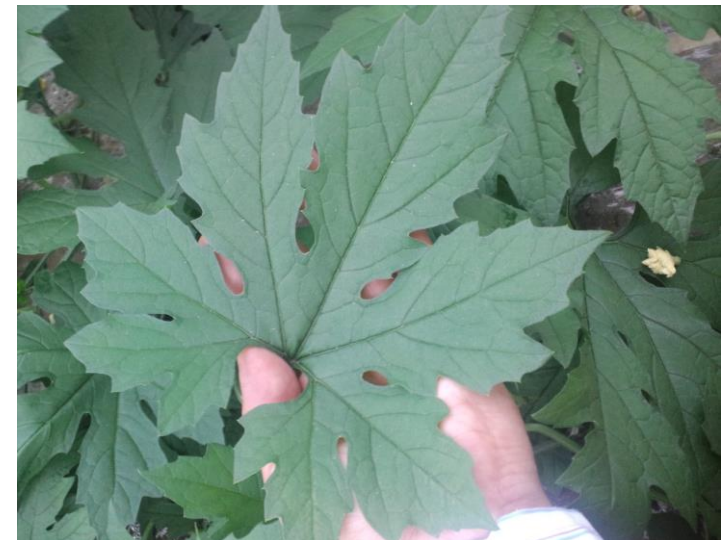
特殊技術で栽培されたMcB

α-グルコシダーゼ活性阻害能力が明らかになりました。 血糖値を調整する評価を表わす国際基準に使われています。