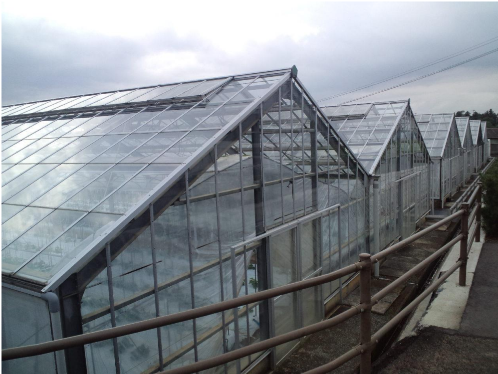
プランテーション風景