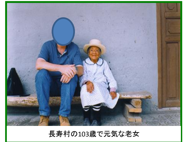
長寿村の103歳で元気な老女

そこでインカ時代以前より受け継がれてきた天然の植物資源に着目し、長寿村「ビルカバンバ」の地域を中心とした広大なアンデス山系での長期に渡る調査を開始しました。調査の結果、発見されたのが「ニガウリ」の原種でした。