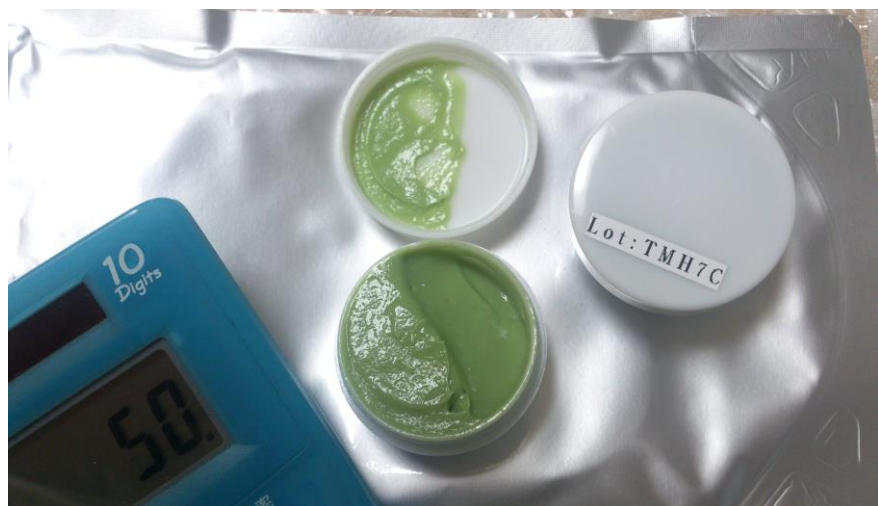
McB濃縮エキス含有スキンクリーム(商品番号:C1・C2)