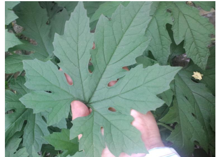
特殊技術で栽培されたMcB

α-グルコシダーゼ活性阻害能力が明らかになりました。 血糖値を調整する評価を表わす国際基準に使われています。